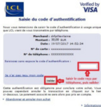
Exemple de saisie du code 3D-Secure transmis par la banque LCL

Ce dispositif, mis en place par votre banque, permet de lutter contre les tentatives de fraude à la carte bancaire.